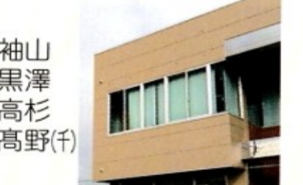
袖山 黒澤 高杉 高野(千)