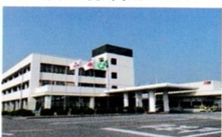
中村、柴田、阿部、加藤木、堀川 富山、川崎、木村(隆)、袖山、 河野(弘)、渡邊(二)、根本