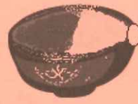
⑦茶碗拝見 (正面が客側)