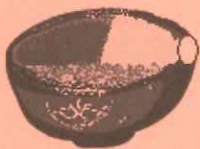
①茶碗正面 (正面が客側)