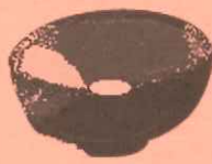
④茶碗飲み口 (正面が左側)