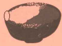
⑨茶碗を返す (正面が亭主側)