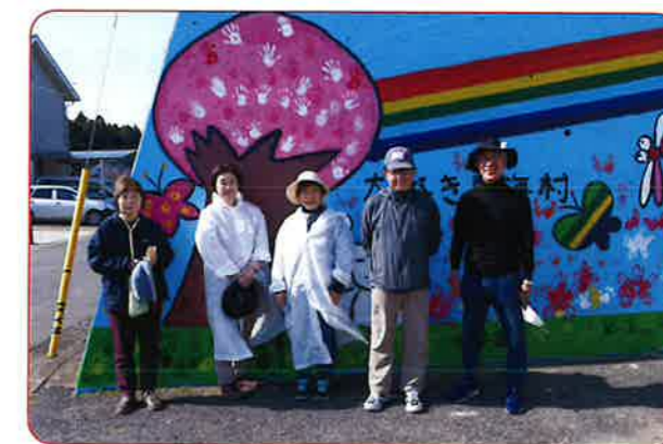
桜の花はみんなの手のひらでスタンプ!!

最後に参加者全員の集合写真にお礼のメッセージを添えた子供たちの手作りカードを各々頂き感無量でした。