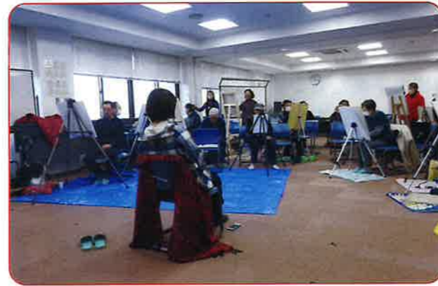
皆さん揃ってのデッサン会も久しぶり、筆がすすみます