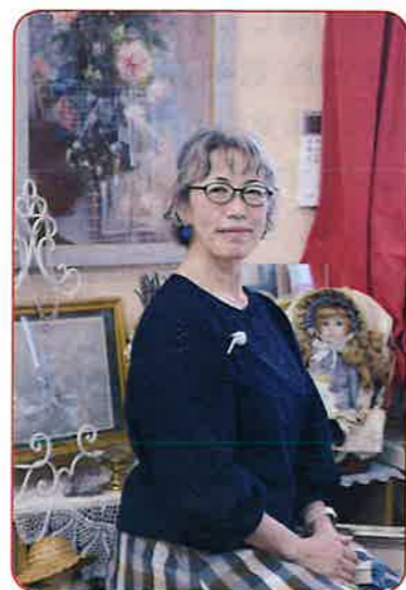
どうぞ、お立ち寄りください

長期間不在になることが多く、美術連盟の方にはご迷惑をおかけしますが、できることはお手伝いしたいと思います。きまぐれフリーマーケットも「もりのこやぎ」を木・金・土曜日にひたちなか市役所沿いで営業しています。旅行中は閉店しますが、お近くにおいでの際は是非お立ち寄りください。