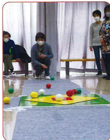
かんたんそうで、なかなかむずかしいオーバーボール

令和6年3月24日(日)中丸コミセンにおいて、会員26名の参加をもちまして令和6年度美術連盟の総会が開催されました。