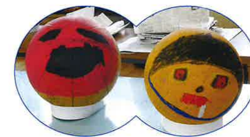
大変良くできました