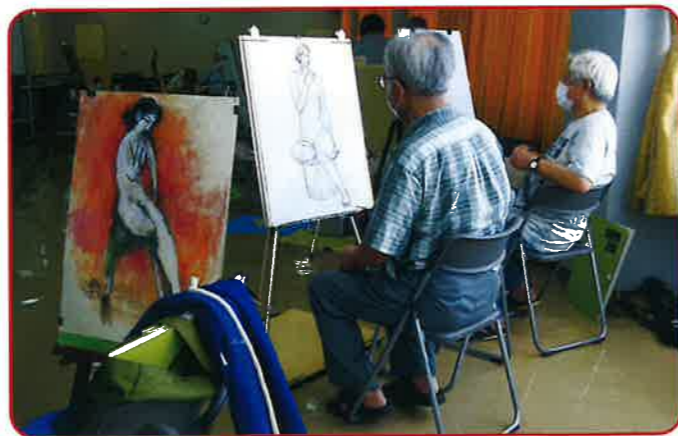
人物がうまく入りましたね