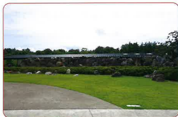
庭園の6000トンの石組みもすばらしい

皆さんの中で是非行ってみたい美術館、推奨したい美術館等、情報がありましたら「パレット」にご紹介ください。