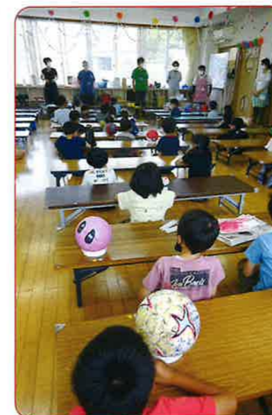
みなさんよくがんばりました。楽しかったね!

パレット編集員: 塙・高野(カット) 塙携帯 080 5682 0625 Eメール: art651222@gmail.com