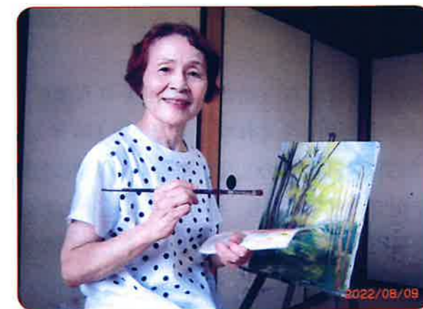
常陸太田市「春友」近くで描いた作品の手直し

年齢と共に、人との会話や交流が少なくなって来ますので連盟や教室に入っていて良かったと思います。