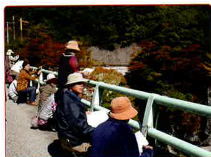
紅葉って、描くの難しいよね!