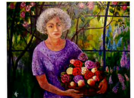
「陽光の中で」 50F 油彩