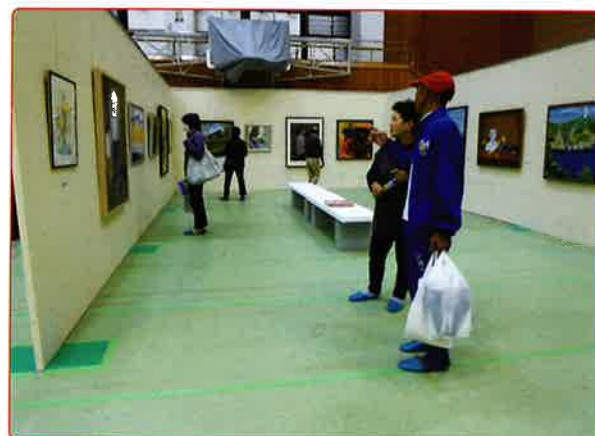
訪れた方は熱心に見ていただきました