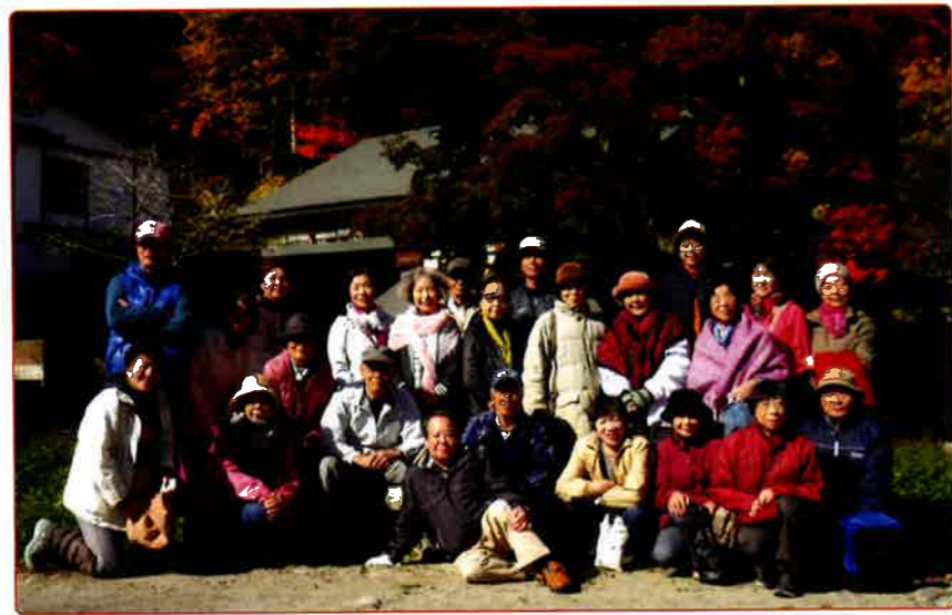
色とりどりの紅葉に囲まれて、集合写真 宿前で

今回のスケッチをぜひ完成させ、皆様とともに鑑賞できることを楽しみにしております。