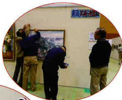
搬入時の飾り付けはすみやかに