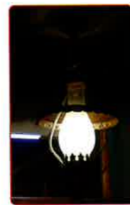
ランプの宿でした。