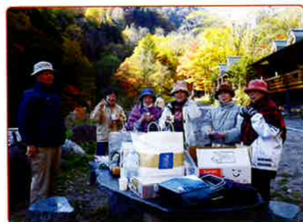
冷えた身体に熱いコーヒーがおいしい