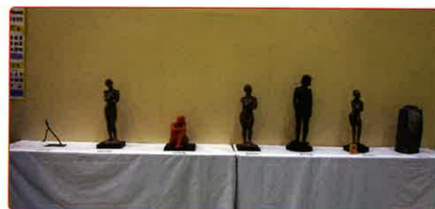
彫刻と工芸はいつもの定位置に