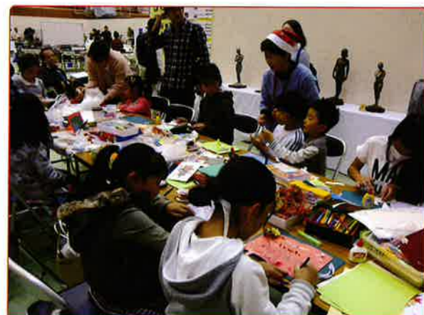
カード作りが始まると時間も忘れて熱中