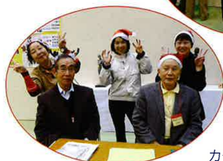
カード作りにはクリスマスの被りもので盛り上げ隊