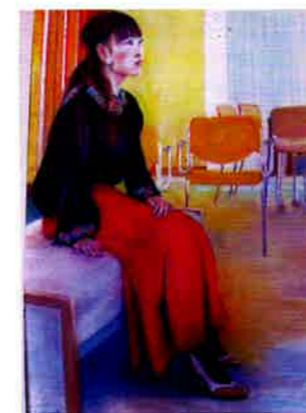
「モデルTさん」 30P パステル