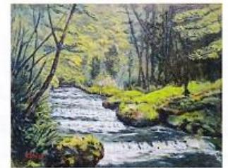
溪流 安斉 克一