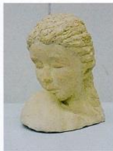
ほころ 三澤 宇紀子