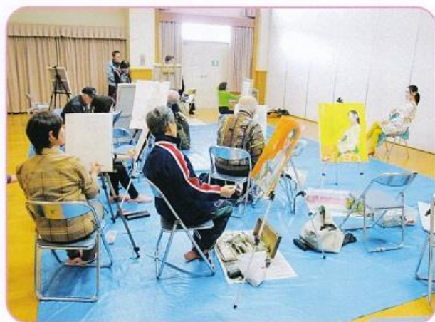
狂いがないか、たびたびデッサンをチェック