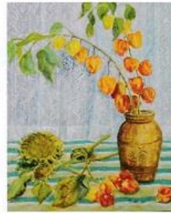
夏のなごりに 柴 量子