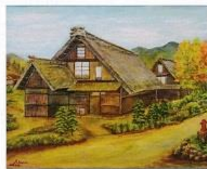
里の秋 桑野 勝男