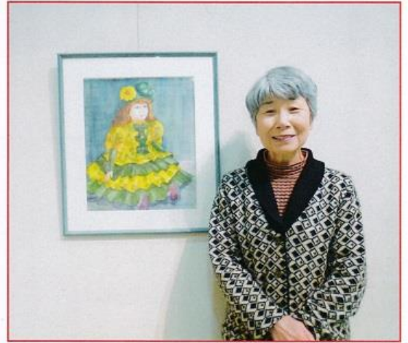
青い目をした人形の作品横で