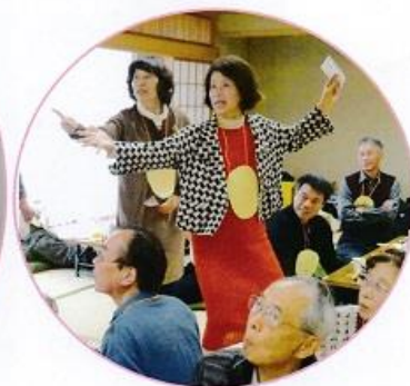
大盛り上がりの家計やりくりゲーム