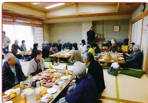
理事長より新年のごあいさつ

歳を重ねるごとに行動範囲は狭くなっていくのは自然な事。でも、それに負けず想像の翼を拡げ、描いていきたいと願っています。せめて気持ちだけでも、今年もがんばりましょう。