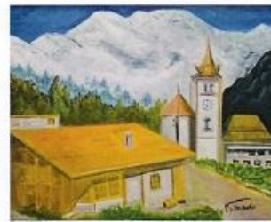
遠い思い出II(スイス) 花田 益江