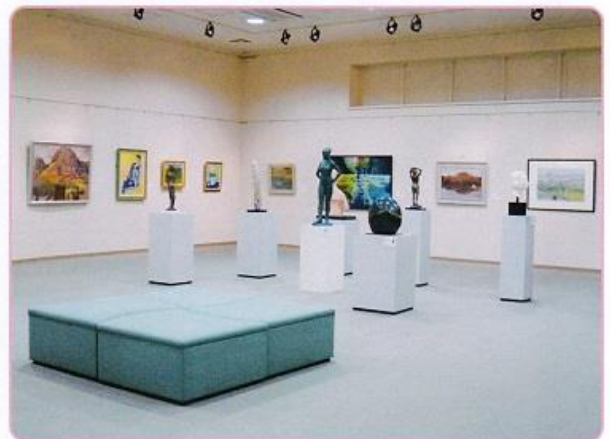
ギャラリーA展示風景、今年は彫刻工芸を中央に

アートロードに参加の連盟会員の皆様には種々ご協力賜りたく、また参加されていない連盟会員の方も事業へのご支援のほどよろしくお願い申し上げます。