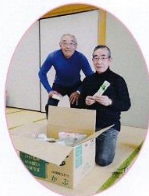
なんと！ ビンゴの1等、2等は 奇しくも新旧理事長