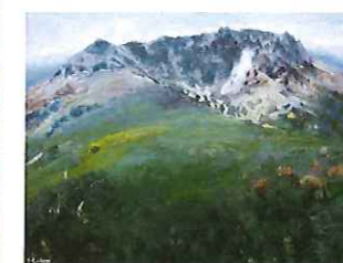
太古の標 栗原 豊