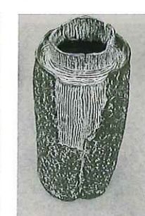
再生 萩野谷 博