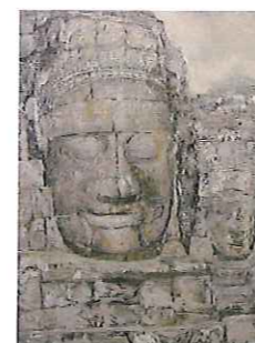
パイオンの微笑 鴨志田 範夫