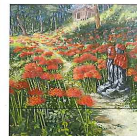
お堂への道 豊島 和久