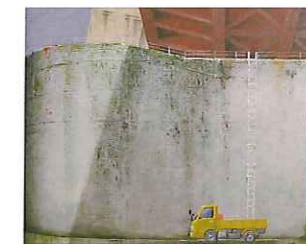
奨励賞 支える 木村 隆