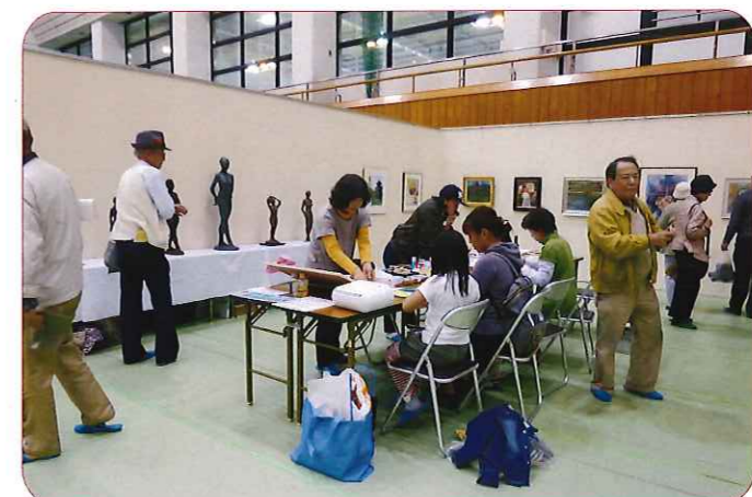
カード作り体験コーナーで、会員がお手伝い

皆上手に作っていました。担当者が手薄でしたので、手が回らず、何人かに手伝いをもらい、何とか乗り切りました。初めての試みで、どのくらい参加してもらえるのか心配していましたが、沢山の方に来て頂いて楽しく出来て良かったです。