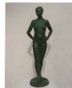
去年の夏 井坂 咲子