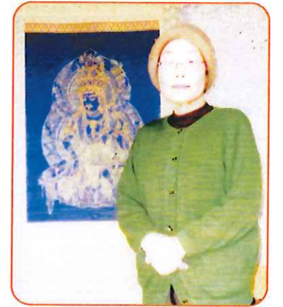
美術連盟在籍したことがある娘さんが描いた仏画の前で