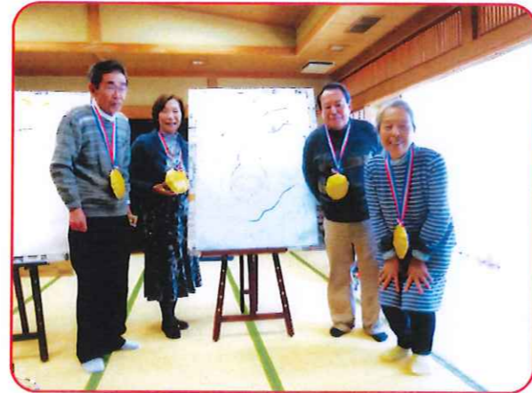
担当した東支部の皆さんの工夫とアイデアで、楽しく盛り上がり新年会でした。満足と感謝の声がたくさん寄せられました。