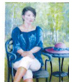
佳作 「高原の夏」豊島和久