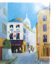
「サクレ・クールのある街角」仲田和子