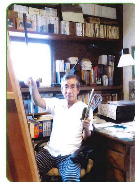
この写真には間違いが何カ所か、あります。さて間違いはどの部分でしょうか？

9月11日～9月17日東海ステーションギャラリーで開きますので、是非おいでください。