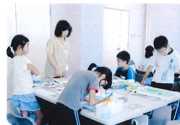
自ら選んだ課題に挑戦中。思うように描けたかな。文化センター会議室で