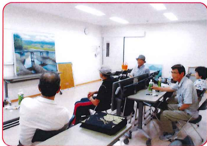
皆さん、ごきたんのない意見をいってください！

近いうちに完成した作品がどこかの展示会で見ることができると思いますので、楽しみにしています。