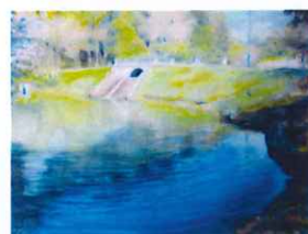
第28回パステル協会展 8.3~8.10(東京都美術館) 関 悌吾「水辺の4月」