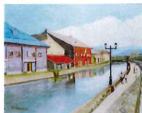
仲田 和子「小樽運河」