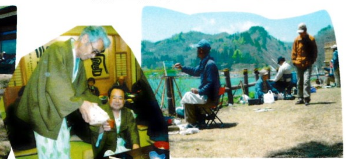
なんつったってどぶろくでしょ。