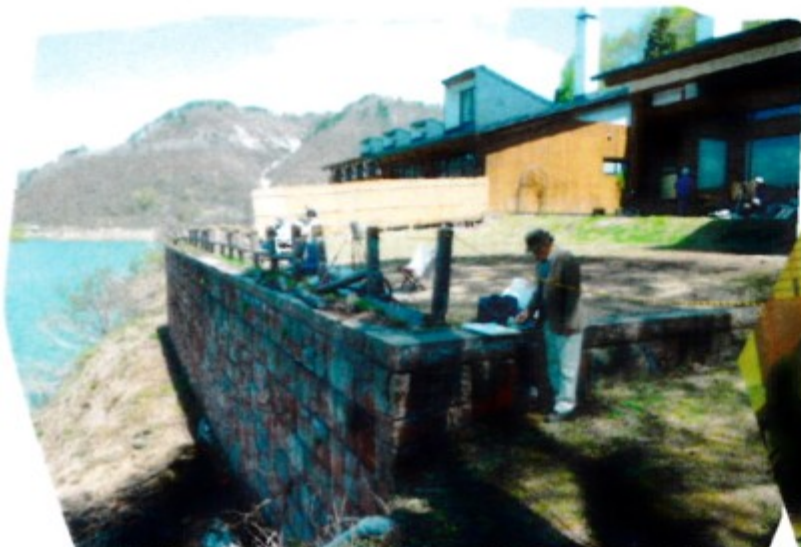
2日目はフォレストホテルの中庭をお借りして・・・