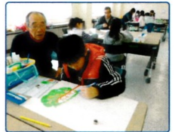
どんどんイメージが湧いて筆が進みます。