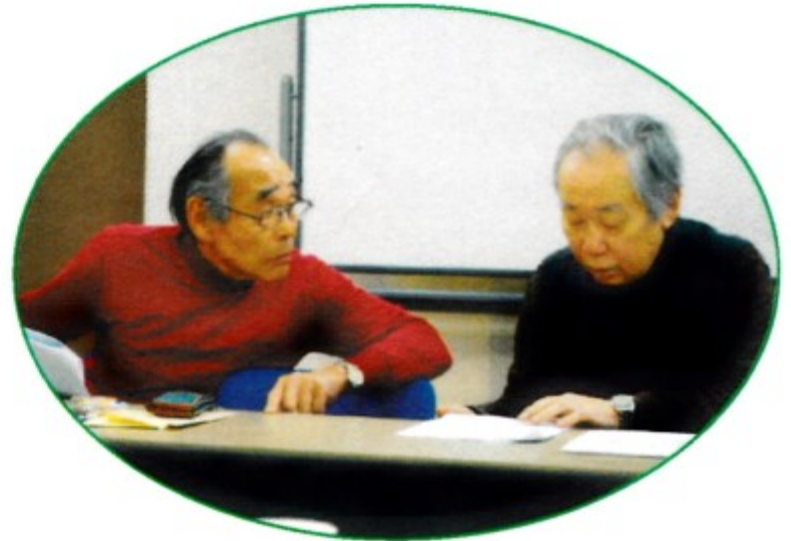
急きょかけつけた理事長と事業の内容確認